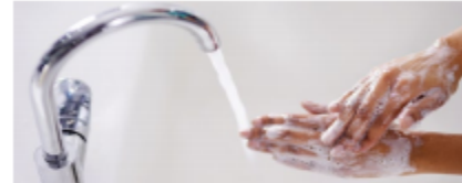
Cuidadora infantil lavándose las manos.

El lavado de manos es una de las mejores formas de detener la propagación de los gérmenes que causan las enfermedades. Asegúrese de lavarse bien las manos siguiendo estos pasos: